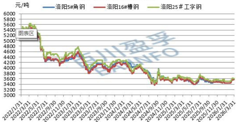
洛阳大中型钢市场走势图