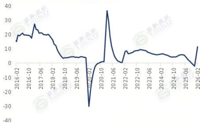
国内基础设施固投累计同比 (%)

1-3月专项债发行前置发力，超1.2万亿元的发行规模及15%以上的同比增速，为基建项目提供了充足资金保障，叠加1-2月基建投资同比增长11.4%的良好开局，前期储备的交通、能源、水利等重大项目将在4月进入集中施工期。随着天气条件全面转好，项目施工效率提升，资金逐步转化为实物工作量，将直接带动基建领域水泥采购量明显增长。考虑到专项债资金传导效应的释放，预计4月基建水泥需求环比增幅有望达到15%-20%，但受去年高基数影响，同比增速可能仍面临一定压力。