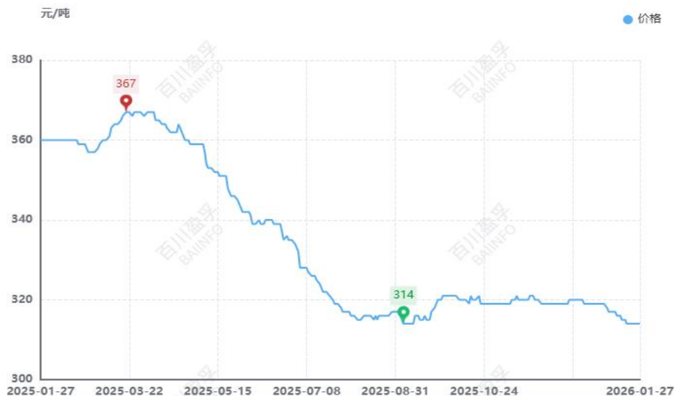
图：本月全国水泥价格均价走势图（元/吨）

供应方面： 由国家统计局最新数据显示，2025年全国水泥产量169314万吨，同比减少6.90%，12月份全国水泥产量14416万吨，同比下滑6.60%。本月水泥产量走势下行，北方地区多数熟料企业继续执行错峰生产，同时下游市场基本停滞，厂家出货量极少；南方地区一季度停窑时间陆续公布，其中华东一季度长三角苏南、浙北及环巢湖等地熟料线企业错峰停窑45天，中南地区，受大气污染环保管控，河南窑线已经全部停窑，两广和海南地区临近年关，水泥市场有一定程度减产，西南贵州地区一季度执行错峰生产65+N天，重庆受环保管控影响熟料厂家12日-20日期间停窑。整体来看，本月水泥产量走低。