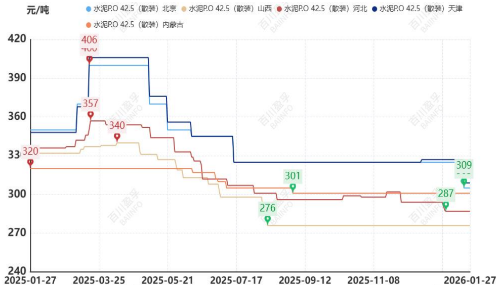
图：本月华北地区水泥价格走势