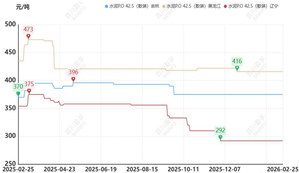
图：本月东北地区水泥价格走势