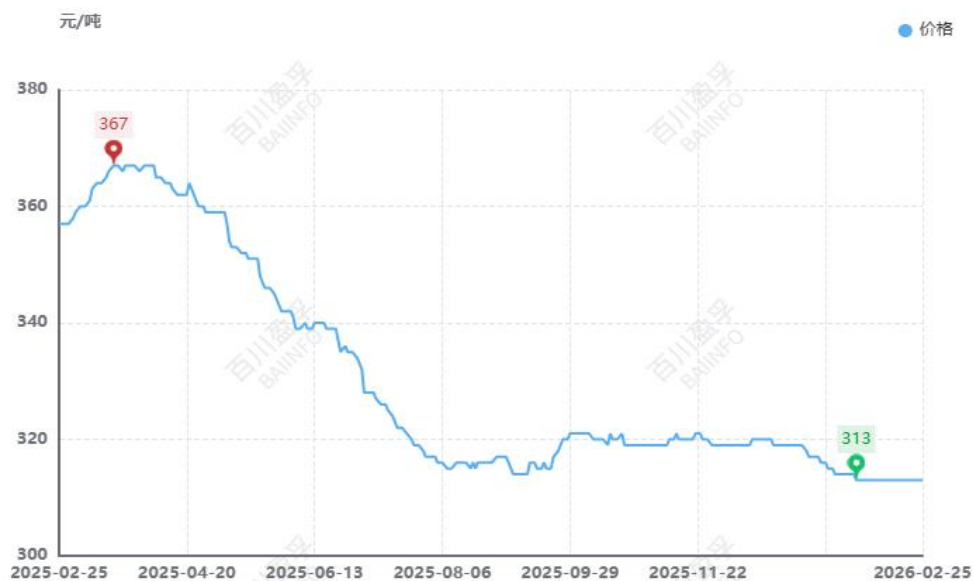
图：本月全国水泥价格均价走势图（元/吨）

供应方面： 由国家统计局最新数据显示，2025年全国水泥产量169314万吨，同比减少6.90%，12月份全国水泥产量14416万吨，同比下滑6.60%。本月水泥产量延续收缩态势，北方地区熟料企业继续执行错峰生产，区域内水泥产能利用率持续走低，产量维持在相对低位，南方地区受春节假期影响，下游工程建设活动大幅减少，多数施工单位停工，水泥市场需求进入淡季，多数厂家停窑检修，水泥短期减产。整体来看，本月水泥产量稍有下降。