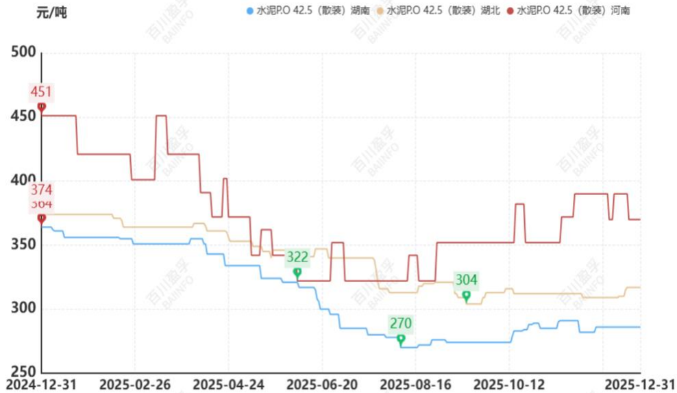
图：本月华中地区水泥价格走势