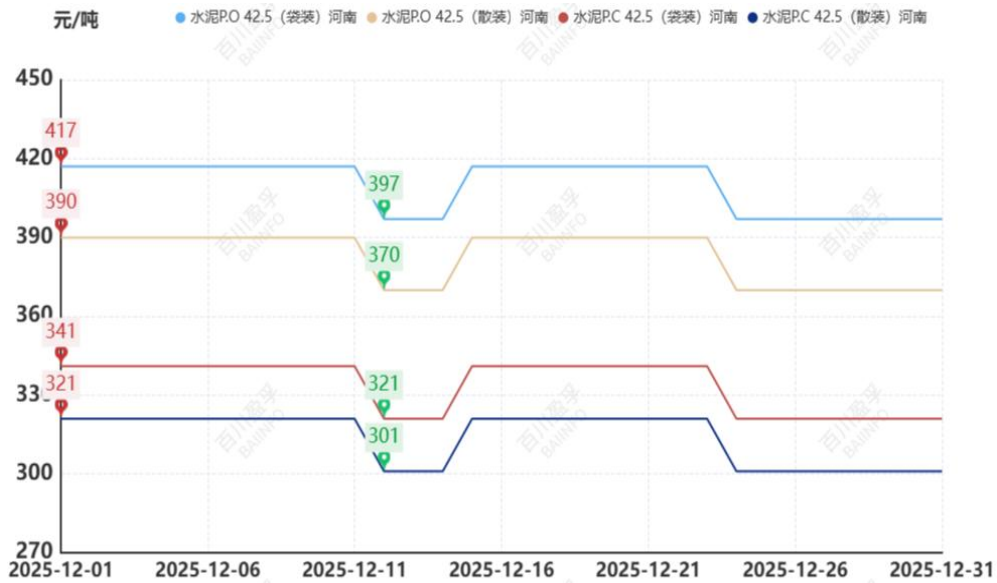
表 河南地区本月与上月均价对比表(仅工作日)