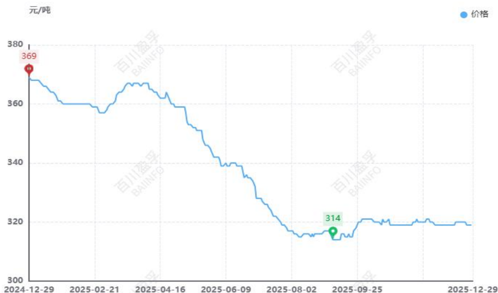
图：本月全国水泥价格均价走势图（元/吨）

供应方面： 由国家统计局最新数据显示，1-11月份全国水泥产量154883万吨，同比减少6.90%，11月份全国水泥产量15434万吨，同比下滑8.20%。本月水泥产量环比变动幅度不大，华东山东地区仍处于冬季采暖季错峰生产阶段，江西地区本月停窑13天左右，浙江地区受环保管控影响，熟料生产线停窑10-12天左右；中南河南地区窑线已经全部停窑，两广一带按需生产；西南区域，重庆地区11月至12月错峰停产55天，其他省份停窑15-20天左右，水泥产量整体呈现弱势；三北地区市场已经进入淡季，熟料生产线已经停窑，水泥产量偏低。整体来看，本月水泥产量小幅震荡。