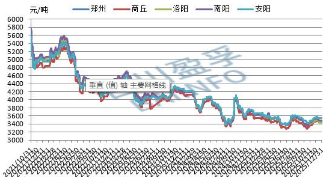
河南地区螺纹钢市场走势图