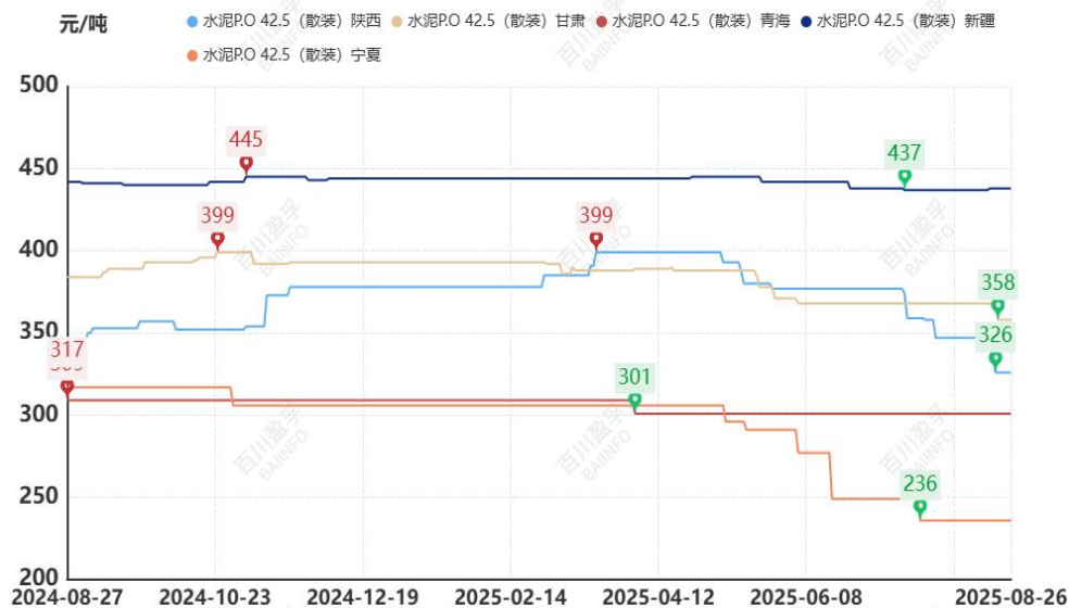
图：本月西北地区水泥价格走势