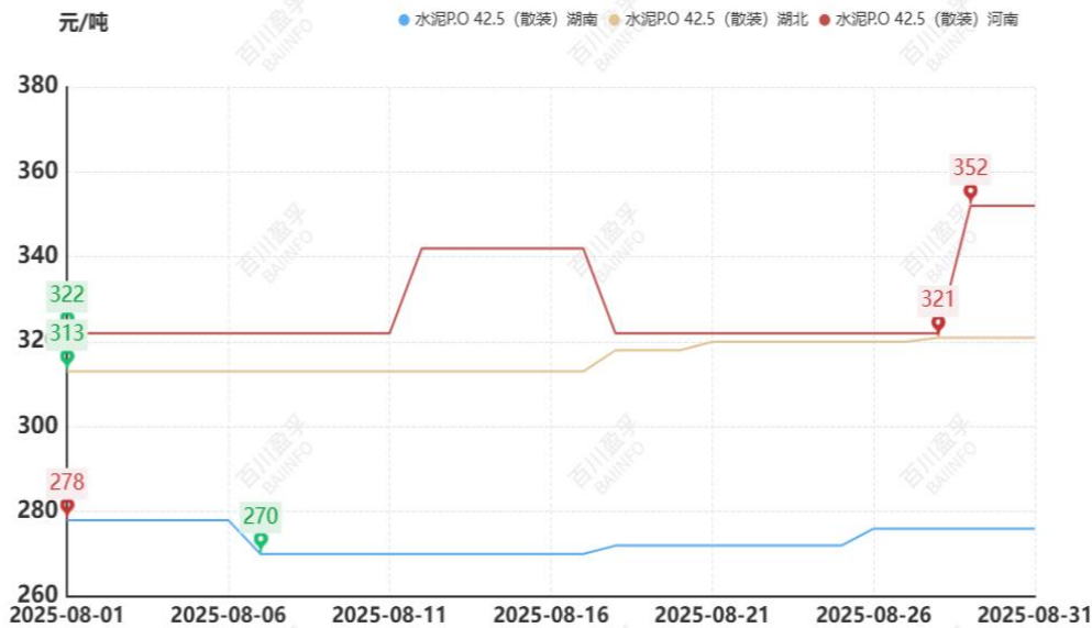
图：本月华中地区水泥价格走势

8月华北地区处于降雨季节，下游工程项目和搅拌站施工受限，水泥需求表现清淡，企业出货仅在正常水平的2-3成，多数企业库存高位运行，受阅兵活动影响，8月20日-9月4日京津冀地区水泥熟料生产线要求停产，工程项目和运输同时受限，水泥成交量再次减少。