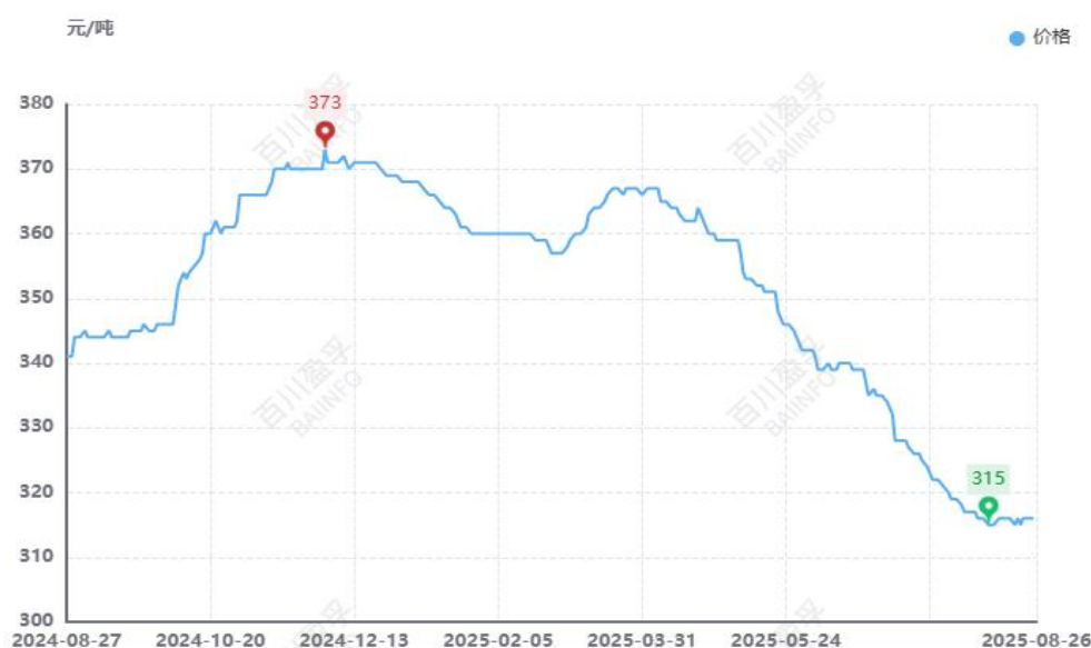
图：本月全国水泥价格均价走势图（元/吨）

供应方面： 由国家统计局最新数据显示，1-7月份全国水泥产量95801万吨，同比减少4.50%，7月份全国水泥产量14557万吨，同比下滑5.60%。本月停窑力度不减，水泥产量仍旧低位，华北、东北停窑管控趋强运行，再次停窑20天以上，当地水泥生产企业库存量普遍低位水平运行；西北地区厂家错峰情况不一；西南云贵等地继续执行15-20天左右的月度停窑计划；华东长三角地区本月停窑10-15天左右，山东地区8月16日开启为期20天的错峰生产，中南一带生产企业自主停窑，水泥生产量偏低，但企业库存压力较大。整体来看，本月各地区严格执行错峰减产，水泥产量较上月变动不大。