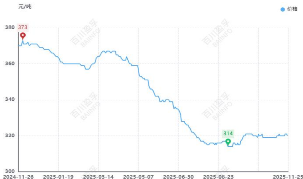
图：本月全国水泥价格均价走势图（元/吨）

供应方面： 由国家统计局最新数据显示，1-10月份全国水泥产量139985万吨，同比减少6.70%，10月份全国水泥产量14775万吨，同比下滑15.80%。本月水泥产量延续下滑趋势，华东福建地区本月继续停窑15天左右，山东地区15日开始采暖季错峰生产，江西地区本月停窑13天左右；中南河南地区受错峰生产及环保管控影响，水泥产量环比减少，两广地区部分厂家停窑检修；西南区域，重庆地区11月至12月错峰停产55天，其他省份停窑15天左右，水泥产量整体呈现弱势；三北多地区已经进入停窑阶段，叠加市场逐渐收尾，水泥产量减少。整体来看，本月水泥产量继续走低。