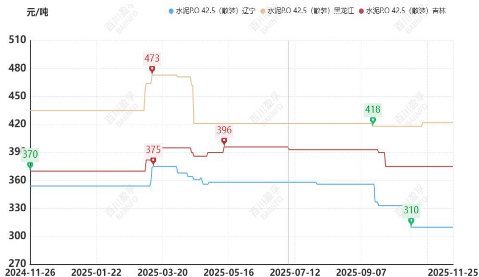
图：本月东北地区水泥价格走势