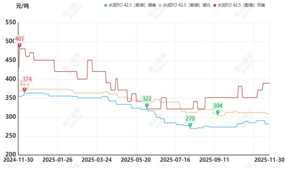
图：本月华中地区水泥价格走势

进入 11 月份华北地区室外气温开始降温，京津冀、山西地区气温下滑缓慢，11 月份仍有工地正常施工，但整体施工量不多，市场行情呈现不温不火的状态，内蒙古地区室外气温较冷，多数工地已经停工，市场接近尾声，本月企业已经处于停窑状态，以消耗库存为主，只有河北局部地区水泥价格提升，其他地区暂稳不变。