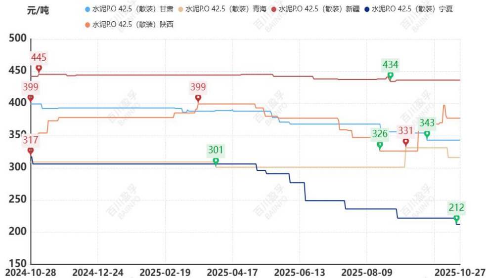
图：本月西北地区水泥价格走势