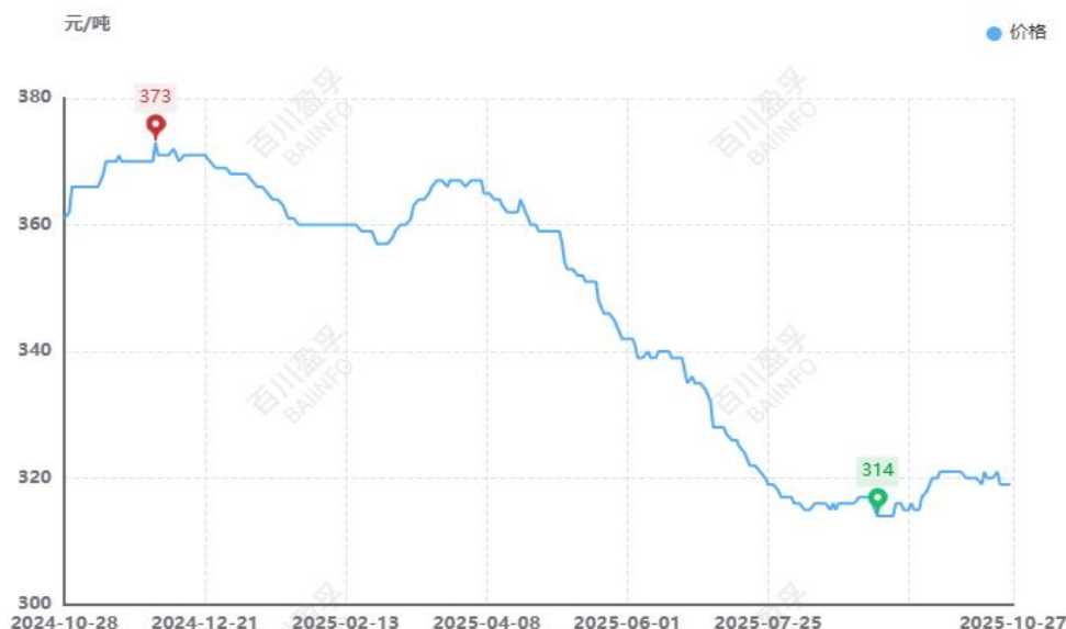
图：本月全国水泥价格均价走势图（元/吨）

供应方面： 由国家统计局最新数据显示，1-9月份全国水泥产量125936万吨，同比减少5.20%，9月份全国水泥产量15444万吨，同比下滑8.60%。本月水泥产量环比变动幅度不大，同比延续弱势。华东福建地区本月停窑15天左右，山东地区9月26日开始停窑20天，预计11月中旬开始采暖季错峰生产，安徽环巢湖等地市场熟料线企业10月期间错峰停窑12天左右；中南湖北地区本月执行错峰15天，河南目前持续停窑，其他市场按需生产；西南贵州本月错峰停窑执行15天，重庆地区9月下旬至10月末停产30天，云南本月错峰停窑执行不少于15天；东北地区开窑正常生产，市场基本按需生产，产量变动不大。整体来看，本月水泥产量小幅波动。