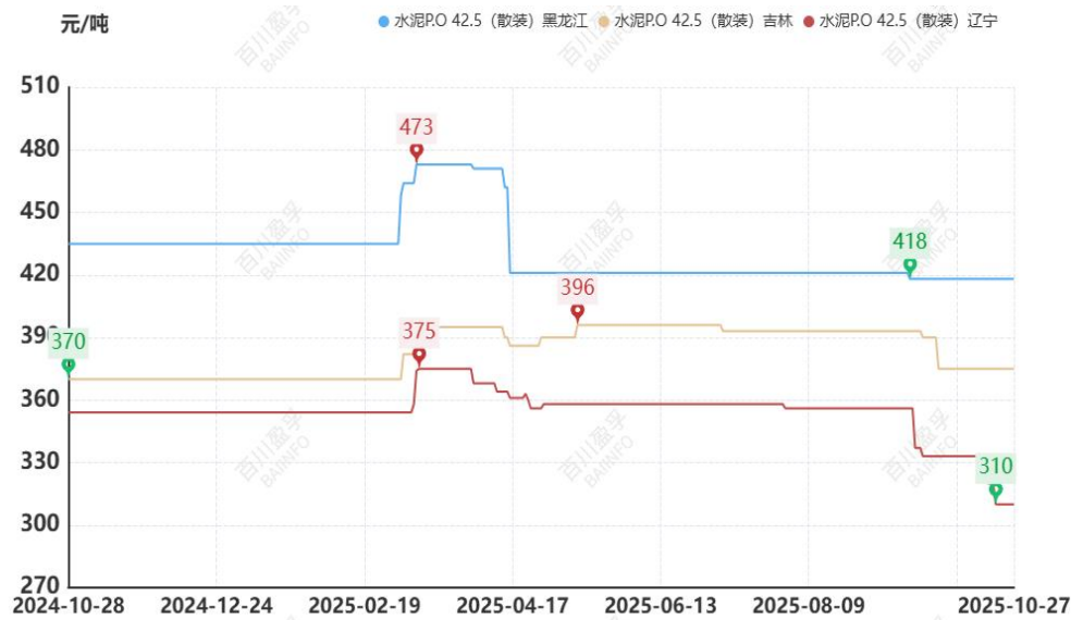
图：本月东北地区水泥价格走势