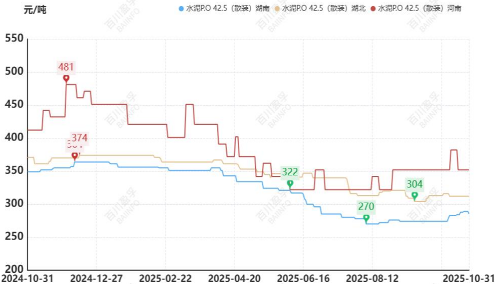
图：本月华中地区水泥价格走势

进入 10 月北方地区室外气温开始寒冷，多数工地进入年底赶工期，按照往年来讲，需求开始提升，企业开始复价为年底以及明年价格打基础，但今年需求持续低迷，市场不温不火，无利好条件支撑水泥涨价，多数企业为下个月停窑做准备。