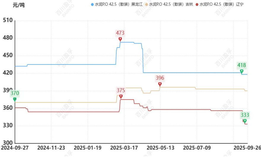
图：本月东北地区水泥价格走势