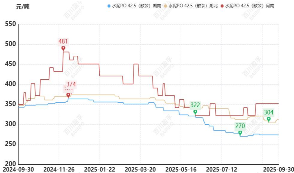
图：本月华中地区水泥价格走势

9 月末即使高温消退、雨水减少，但整体市场行情未见改善，9 月初京津冀地区受阅兵管控多数工地停工，需求受限，但阅兵后有涨价消息，但由于需求有限，价格难以落地，山西、内蒙古地区截止到目前为止当地暂无新项目启动，市场需求难以增加，导致本月价格平稳运行。