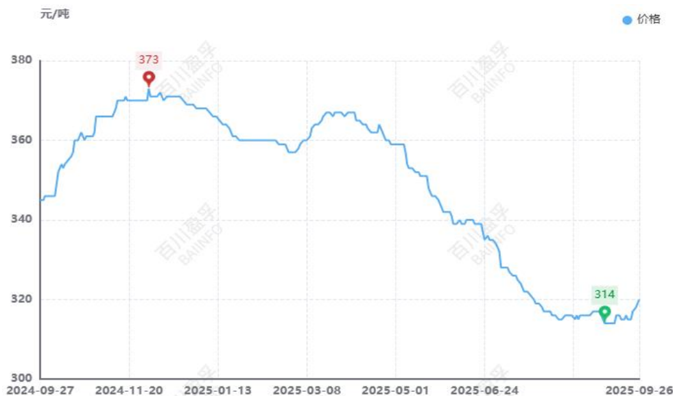
图：本月全国水泥价格均价走势图（元/吨）

供应方面： 由国家统计局最新数据显示，1-8月份全国水泥产量110457万吨，同比减少4.80%，8月份全国水泥产量14802万吨，同比下滑6.20%。本月水泥产量同比延续下滑趋势，环比稍有增加。华东福建地区本月停窑18天，山东地区9月初恢复生产，26日开始新一轮错峰停窑，长三角一带熟料线企业执行错峰停窑8-12天左右；中南一带生产企业自主停窑，水泥企业库存压力较大；西南多地区执行20天左右的月度停窑计划；东北地区市场无序竞争，各厂家纷纷开窑生产，水泥产量增加；西北地区开窑正常生产，市场基本按需生产，产量变动不大。整体来看，本月水泥产量小幅增加。