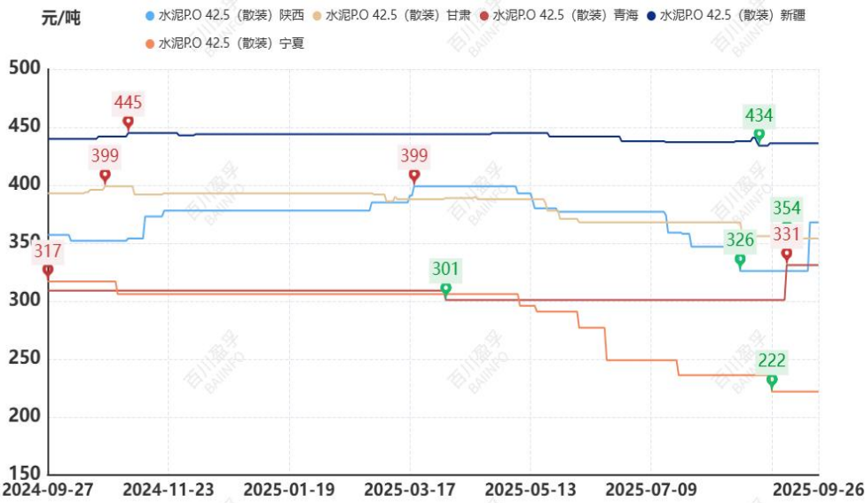
图：本月西北地区水泥价格走势