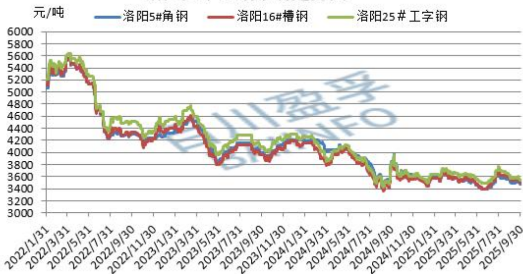
洛阳大中型钢市场走势图